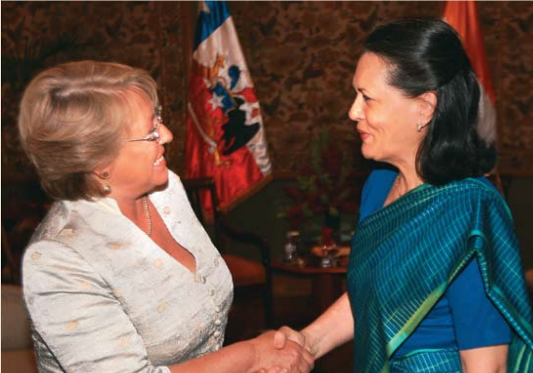
यूपीए चेयरपर्सन तथा कांग्रेस अध्यक्ष श्रीमती सोनिया गांधी ने नयी दिल्ली में चिली की राष्ट्रपति डा. मिशले वैशलेट से मुलाकात की।