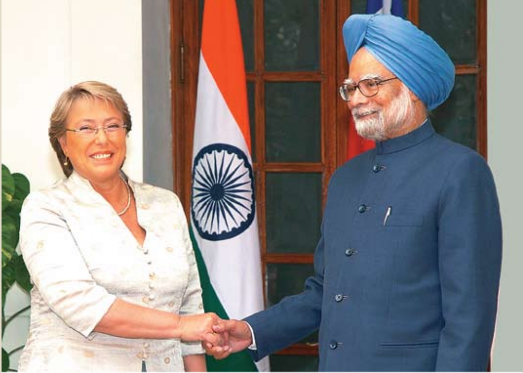
प्रधानमंत्री डा. मनमोहन सिंह ने 17 मार्च, 2009 को नयी दिल्ली में चिली की राष्ट्रपति डा. मिशले वैशलेट से मुलाकात की।